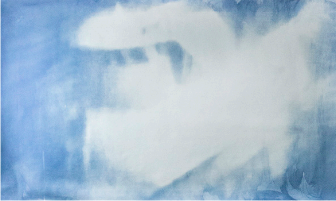
Tamara Kametani, Half a mile from Lampedusa , 2017, cyanotype sur papier. © Tamara Kametani

de Brighton. Lhuisset a dédié la série à son ami Foad, mort noyé en Méditerranée.