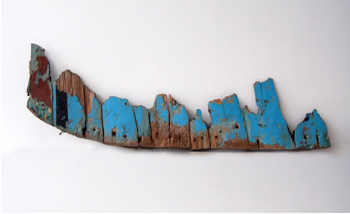
Maya Ramsay, Leave or Remain , 2017, restes d'un bateau de migrants naufragés, 40 x 128 x 10cm, © Maya Ramsay.

Heller et Lorenzo Pezzani, les membres fondateurs, adressent depuis 2011 un « regard désobéissant » sur les violations des droits de l'homme commises par les États membres de l'espace Schengen en Méditerranée. Ils ont lancé la plateforme cartographique en ligne Watch the Med qui localise les zones de recherche où ont lieu les traversées des migrants et dont les autorités ont la responsabilité.