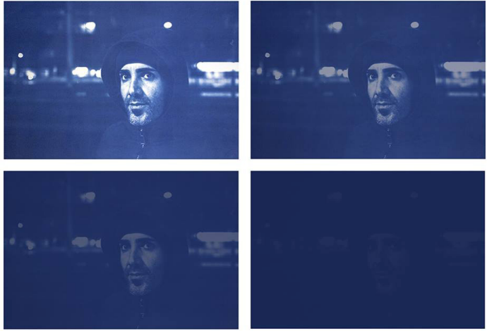
Émeric Lhuisset, L'Autre Rive , 2010–2017, cyanotype sur papier. © Émeric Lhuisset

plus haut (p. 16), reprise sans plus d'approfondissements et de façon quasi-identique à la page 195. Or, certaines œuvres du corpus de « l'esthétique de la subversion » utilisent précisément comme support des restes de « bateaux en bois [...] qui ont saturé l'esprit des spectateurs », des corps, comme par exemple Leave or Remain de Maya Ramsay ou Distant Neighbours-T06114 de Lucy Wood.