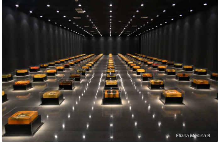
Erica Diettes, Relicarios , 2016, installation. © Erica Diettes.

à empêcher l'anonymat des disparus en Méditerranée. L'effort de description de ce champ esthétique est tout à l'honneur de Mazzara et la classification qu'elle opère rassemble pertinemment les œuvres recourant à des thématiques ou des procédés similaires. Cependant, à l'exception de l'artiste star Ai Weiwei, on regrettera que le corpus soit pour l'essentiel limité aux œuvres exposées par l'autrice elle-même sans les mettre en dialogue avec d'autres œuvres récentes qui reprennent des procédés ou des thèmes similaires.